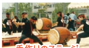
手作りのステージ