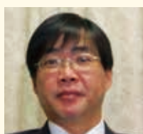
公益社団法人 大阪社会福祉士会

全ての市民の方々が安心して生活できるように、誰も取り残さない、持続可能な相談支援を「権利擁護相談センターいばらき」を通じて実現できるように、運営委員の一人として鋭意取り組んでいきたいと思っております。