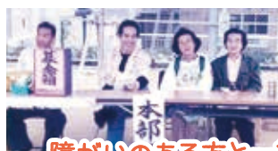
障がいのある方と一緒に“まつり”ができた