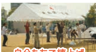
自分たちで棟上げ

そこから一年一年開催を重ね、ついに30回に。当時の想いを引き継ぎながら、参加団体も増え、大きなお祭りに育ちました。第30回の開催に向け、記念企画を練っています。ぜひ、『みんな集まって』ください。