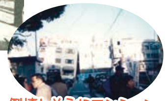
倒壊しそうなマンション