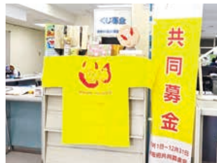
社協事務所での 募金受付

赤い羽根共同募金(10月末時点) 2,297,188円 / 歳末たすけあい募金(10月末時点) 1,275,655円