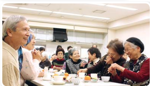
▲「久しぶり！」と言いながらお喋りも弾みます♪