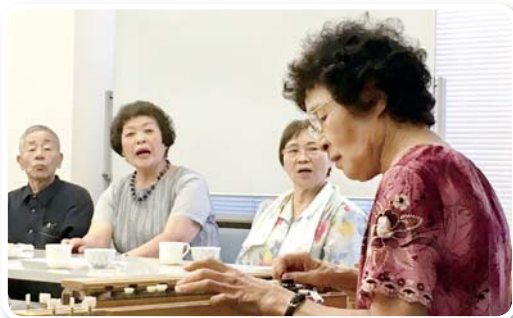
▲歌って楽しんだり、おしゃべりに花を咲かせたり。

食事も終わり、ある方がお隣の方の肩を「トントン」と叩き、耳元でこっそり「あの何歳かねえ？」と。そして答えを聞いて目がさらに大きく。「へえ～！そんな歳には見えへんなあ。身近にエエ見本がおるわ。見習わとなあ」みなさん『お歳』のことには敏感なようで、おしゃべりしながら『お手本』の方をまじまじと見つめる表情が、とてもイキイキと輝いて見えます。