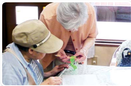
▲先生を独占して靴の製作中！！