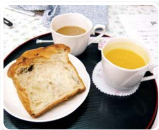
▲朝ごはんを食べてきても、ついつい食べてしまう手作りスープ

今後も「りんりん」の場を活用して、地域の繋がりの輪が広がってほしいと思っています。