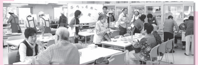
▲今日はどこに座って誰と話をしようかなあ～

参加者の中には、自分で漬けたお漬物を持って来てくれる方、そしてそのお漬物を楽しみにされている方、いろいろな方々が集