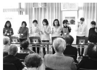
▲参加する人みんなが笑顔で楽しみます

高齢者の集まり、デイサービスのレクリエーション、視覚障害の方の集まり等で一緒に歌うなどの活動を続けてきました。