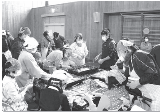
▲一生懸命お餅を丸めていたら 手も顔も真っ白!!