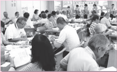
▲特別メニューの時は いつもと違う雰囲気ワクワク☆

こころ和む地域づくりの場として、人と人のつながりの場として、誰もが『ぶらっと』立ち寄って、お茶を飲みながら気軽に話せる居場所をつくろう!