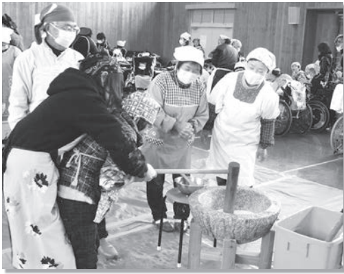
▲ぺったん！ぺったん！ お餅をつくのって大変だなあ

他校の友だちとの交流に加え、地域の人たちとも交流がある支援学校は大阪府内でも珍しく、支援学校の生徒たちも楽しみにしてい