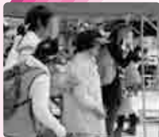
アイマスク体験コーナー