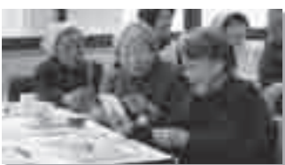
みんなでワイワイ、ビンゴ大会!