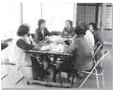
思い思いの時間を過ごすことができます。

前回本誌(No.176)にて西河原地区「地区知恵のわプラン」を掲載しましたが、その成果として平成26年度より「カフェサロン」を実施する予定です。