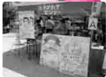
ボランティア活動を紹介しているブースもあります。 お気軽にご相談ください。