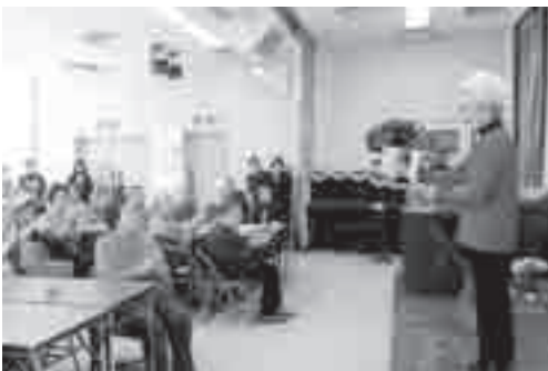
内容も盛りだくさんで楽しいひとときです。

この様にひとり暮らし高齢者の食事は、地域の皆さまと支え合い、「おもてなし」の心で成り立っている、居心地の良い事業となっています。