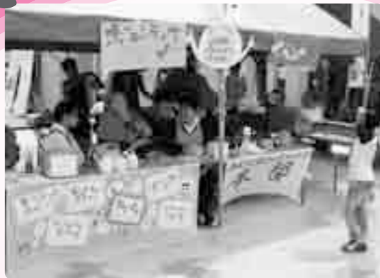
「チラシ配付」に「水まき」か? 何のボランティアをしようかな? (やってみようボランティア)