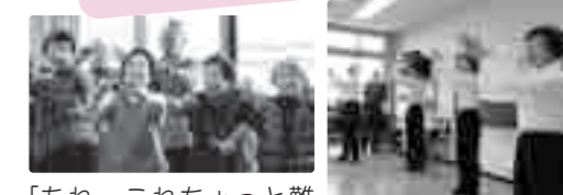
「あれ〜これちょっと難しいなあ」みんなで笑う事が何よりもの予防に繋がります。リズムに合わせて、パンパンパン