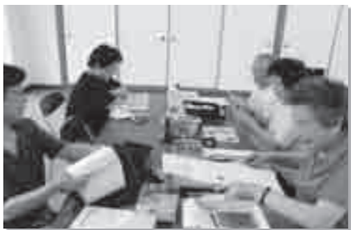
お茶とお菓子で話はずみです。

対象に特色あるプログラムを提供していますが、この「カフェサロン」では、どなたでも参加いただける自由なものとなっています。平成25年度から実施をし、既に多くの方に利用していただき写真にあるように皆さん集まって話をして、一緒にの机で趣味の手芸