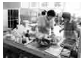
施設でのちょっとしたお手伝い