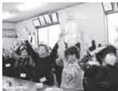
みんな一緒に歌体操！ 大きな栗の～木の下で～♪

を学び合うことから、「他のサロンの良い部分を自分なりに取り入れたい」という意見も出て、作成を通じて、現在の「サロン」の見直しにもつながっています。 今回は、現状の「強み」を活かすところを進めてきましたが、今後は、課題解決に向けた「地区知恵のわプラン」の作成に向けて話し合いを行っていく予定です。