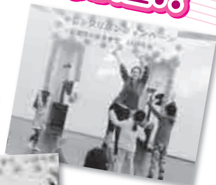
英語で楽しく歌遊び!