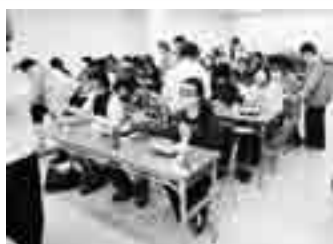
アイマスクをしての食事体験

視覚障がいを持つ人の外出支援や、余暇活動のサポートをするボランティアの養成を目的としています。