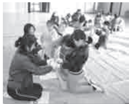
四苦八苦している子どもに優しくアドバイス

で柔らかくし、そこから参加者がきれいに揃えたわら束を最後の最後まで力いっぱい編んでいきます。