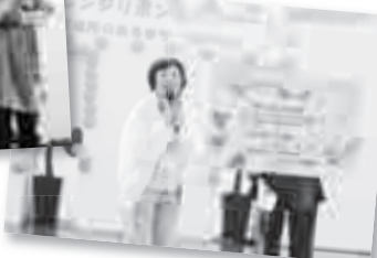
福井地区子育てサロン