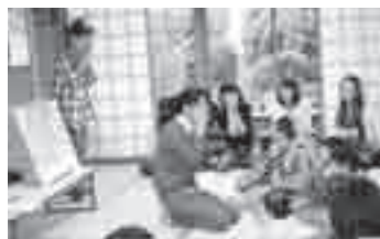
子育てサポーターさんを招いた子育てサロン

を学び合うことから、「他のサロンの良い部分を自分なりに取り入れたい」という意見も出て、作成を通じて、現在の「サロン」の見直しにもつながっています。 今回は、現状の「強み」を活かすところを進めてきましたが、今後は、課題解決に向けた「地区知恵のわプラン」の作成に向けて話し合いを行っていく予定です。