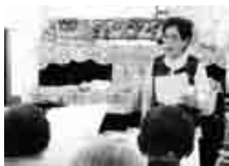
趣味を活かしての活動(詩吟)

「自分にあったボランティア活動はどんなものだろう」「1人での活動はちょっと不安だな」と、活動の一步がなかなか踏み出せない人はたくさんいるのではないのでしょうか。