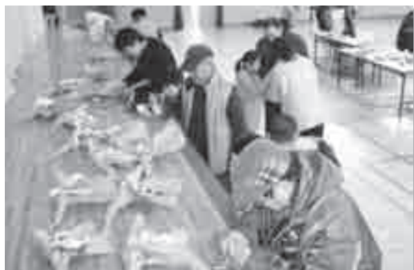
初めて作ったしめ縄！みんな上手にできたかな？

これらのしめ縄は、一週間後に開催される安威公民館の文化祭に展示され、正月には各自の玄関に飾られます。お正月が楽しみですね。