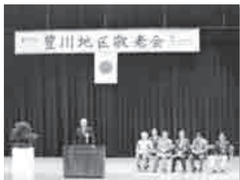
綺麗なホールでゆったりと式典に参加

会場は早稲田摂陵高校で、この高校の生徒さんは、敬老会の前日に行われた赤い羽根街頭募金にボランティアで参加されています。とても綺麗な生徒会館ホールには、たくさんの方々の参加がありました。