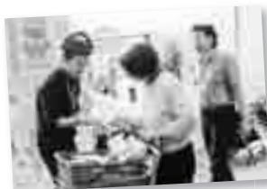
歳末たすけあい運動の啓発も行いました

さらに、専門職の方々による、子育てに関する相談もあつたりと、会場は参加された、たくさんの親子で大賑わいでした。