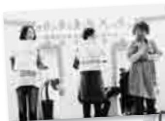
玉櫛地区子育てサロン

耳原地区は、毎月子育てサロンに参加されている親子も一緒にダンスを踊ったり、山手台地区は会場の子どもたちを巻きこんだ、巨大バルーンで遊びました。また、玉櫛地区は指人形劇、福井・穂積地区はかわいいパネルを使った子育てサロンの紹介をしました。