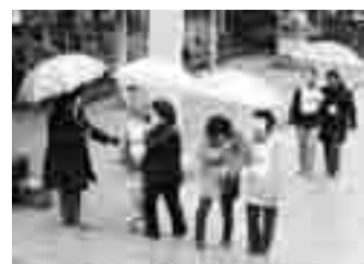
実際に外へ出ての手引き体験 ひじをしっかりとって下さいね。