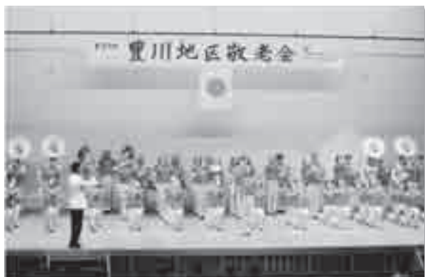
華やかで煌びやかな演奏には圧倒されます

シアターで音楽祭を楽しむような“良い音楽”満載の豊川地区敬老会は、参加者全員をロマンティックな世界にお誘いすることができたのではないのでしょうか。