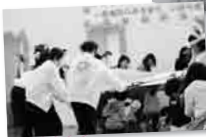
子どもも大人も大盛り上がり!