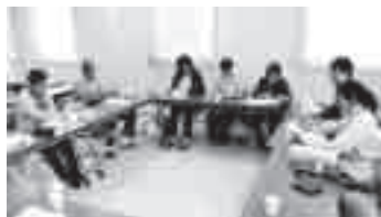
策定検討委員会の様子

検討の中では、各いきいきサロン（4か所実施）の現状も改めて見つめ直し、それぞれの良さ