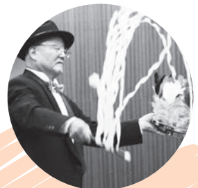
笑いっぱいのマジックショー

お茶で一息ついた後で特に盛り上がりを見せたのは、演芸発表でのマジックショー。ネタがバれてしまうのもご愛敬☆会場内は爆笑の渦に包まれ、参加者の皆さんにとって、お腹も心も満たされるひとときとなりました。