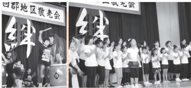
力強い演奏を披露した和太鼓

郡小学校和太鼓同好会の園児から大人まで力を合わせた演奏、児童とPTA有志によるコーラスの綺麗なハーモニー。そしてその姿をお孫さんと一緒に見られる参加者の方々。地域内での互いの“絆”の深さも伺えました。