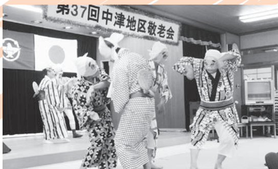
盛りあがったひょっとこ踊り