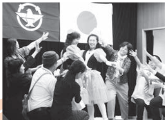
みんなで作りあげた演劇

NHK朝の連続ドラマ「あまちゃん」の演劇では、100円均一で買った水切りネットを使用した手作りの衣装と踊りで、たくさんの方の応援が上がり、会場は参加者も出演者も、皆の笑顔であふれていました。