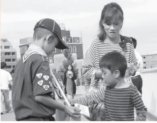
10月5日には学生やボーイスカウトの子どもたちの協力も得て、街頭募金を行いました。皆様の温かいご支援、ありがとうございました。