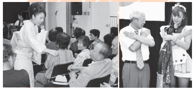
懐メロで盛りあがった歌謡ショー

「敬老会キックオフ！確認しましょう、変わらぬ元気とよい笑顔」をテーマに掲げ、マジックや歌謡ショーで館内は大盛り上がり。途中退席される方もなく、最初から最後まで元気な笑顔が見られました。