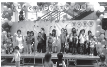
写真は昨年の「アル・プラザ茨木」での模様です