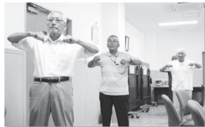
いきいきと体操しています

圧測定や健康等に関する情報提供、歌体操ボランティアによる健康体操等が行われており、毎回約20名程度の参加を得て、賑やかな時間を過ごしています。