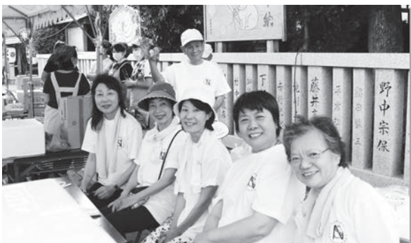
地域のみなさんが笑顔でつながっています

“より暮らしやすい地域に より笑顔あふれる地域に” 沢池地区福祉委員会では、お子さんからご年配の方までが楽しめる様々な取り組みを行っています。11月14日(木)には給食会が、12月10日(火)には保健師を招いた育児相談もある子育てサロンがそれぞれ開催される予定です。日頃の生活の気分転換に、また新しい輪を広げるために、ぜひお越しください♪