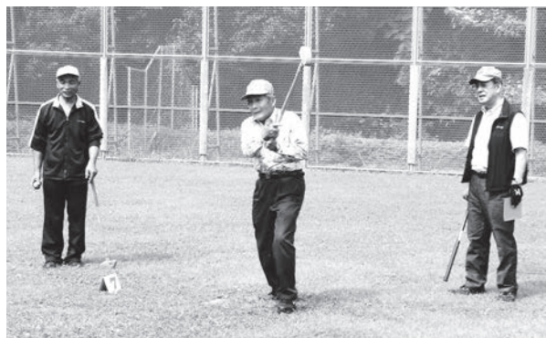
「ナイスショット」と元気な声とびかいます

また年に2回は、忍頂寺スポーツ公園でグランドゴルフ大会を開催。この6月には晴天のもと約60名の高齢者が参加され、みなさん元気あいあいの中にも真剣なプレーが繰り広げられました。次回は12月3日(火)に開催予定です。