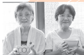
けっこうなお点前で…