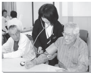
健康チェックを毎回実施しています

見山地区福祉委員会では、『健康でいきいきとした生活をおくること』を目指して、事業を進めています。