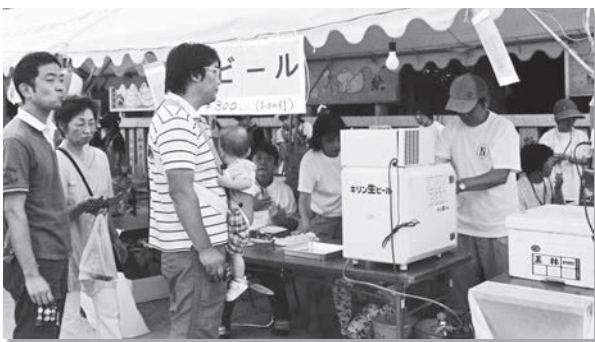
たくさんのお客さんが並んだ模擬店

沢池地区福祉委員会では、今年は冷たい生ビールを提供していましたので、店の前は長蛇の列！大人たちの渴いたのを潤し、さらに活気の溢れる祭へと導いてくれました。