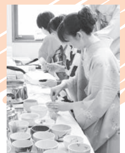
着物姿でお茶を点てます