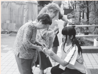
参加者をお迎えした敬老会

自分の住む地域で「自分にも何かできればなあ」「ボランティア活動をしてみたいなあ」と考えている人は、ぜひ茨木市社会福祉協議会にお問い合わせ下さい。