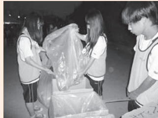
ゴミ処理の手伝いをした「東地区ふれあいまつり」