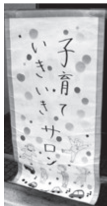
▲子育てサロンといきいきサロンを同時開催

「地区知恵のわプラン」モデル地区のひとつである新郡山地区では、子育てサロンといきいきサロンを同時開催し、世代間交流の「場」をつくりながら、世代をこえた「和」づくりも進めています。