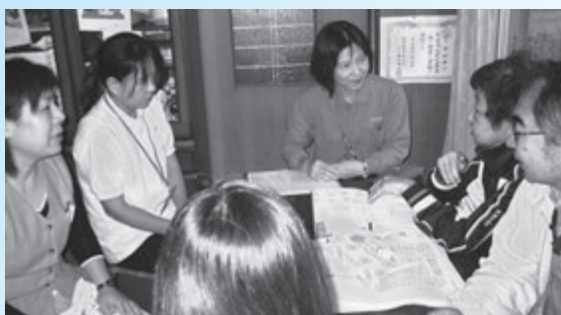
サービス担当者会議の様子

ケアプラン作成にあたっては、サービス担当者会議が開かれ、本人の健康の悩みや介護者の想い等を聴き、その解決や改善のためには、どんな支援が必要なのか、各関係機関から様々な意見が出されています。社会福祉協議会は、様々