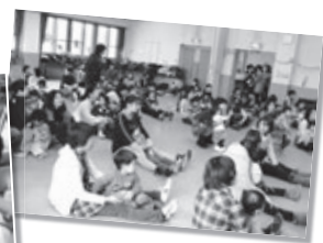
親子サロンの様子