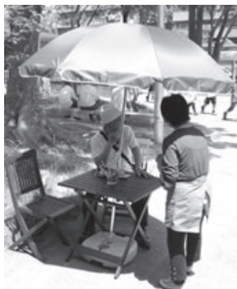
▲パラソルの下で優雅にティータイム♪

社協では、今後もこうしたそれぞれの地区の意見を取り入れ、その地区らしい「地区知恵のわプラン」による各事業のさらなる発展と向上を目指していきます。