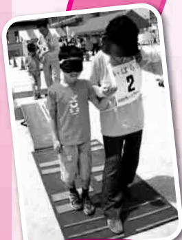
アイマスク体験コーナー