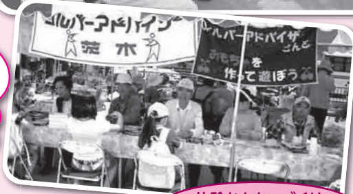
体験おもちゃづくり コーナー

当日のボランティアスタッフを募集しています 詳細はボランティアセンターまで TEL 072-627-0086