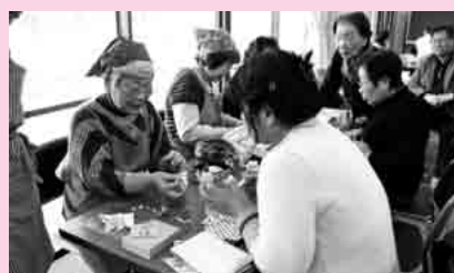
白川高層住宅集会所の「いこい亭」(月2回 第2、4水曜日)

世代を越えた交流が深まり、そこから個人や地域の困り事も浮き上がり、また継続的な見守りの場にもなっています。これらは社協地域福祉活動計画にある『地域の拠点作り』の一つといえます。誰もが「ぶらっと」やっ来て、「ホッと」する場。そんな『地域の拠点』が一つでも多くできるよう、今年度も各地区と一緒に取り組んでいきます。