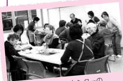
東コミュニティセンターの「いこいこ亭」(月2回 木曜日 (不定期))

関係なくいろいろな人達がやって来て、お茶を飲みながら笑顔で会話の花を咲かし、様々な交流を生んでいます。こうした喫茶に来れば、誰か