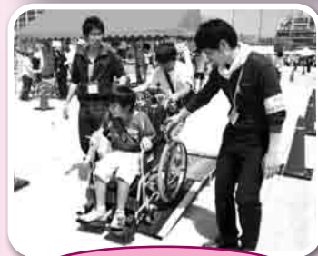
車いす体験コーナー