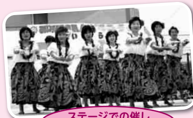
ステージでの催し (フラダンス)

第20回という節目を迎え、今年は「よりボランティアを身近に感じてもらう」と様々な催しを行います。『体験型スタンプラリー』や『ミニボランティア講座』、参加型ボランティアとして『ボランティアグランプリ』を会場内で実施します。その他、ステージでのミニコンサート、バザーや模擬店、食べ物の販売等も実施しています。