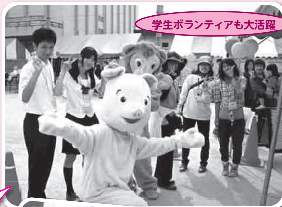
学生ボランティアも大活躍