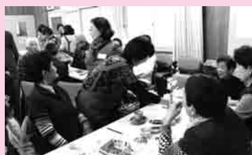
水尾コミュニティセンターの「ぶらっとホーム水尾」(月1回 毎月10日予定) ※8月、10月を除く

こういった何気ない空間を求めて交流が広まり、また来てもらったことで見守りにもなる。まさにこれが「憩い」の空間(場所)の良さ、『地域の拠点』の良さなんですよ。