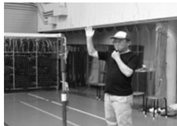
風船バレーの審判研修に参加

がら集う「おしゃべりハウス」を毎月4回開催したり、市内の高齢者のサービスや施設等を紹介するガイドブック作成活動なども行ってきました。