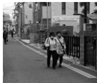
視覚障がい者の移動支援中