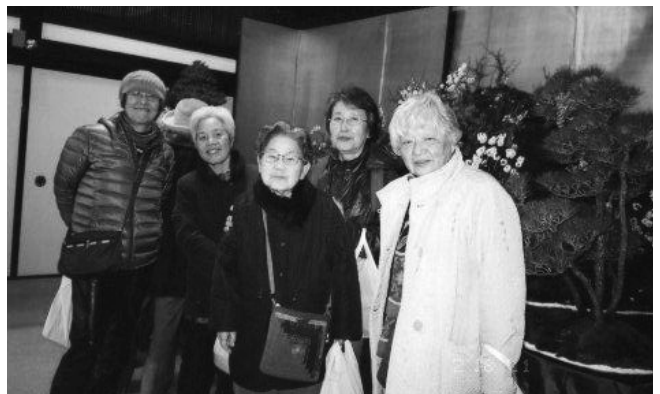
「おしゃべりハウス」では時々みんなで外出もします

周りの人も自分達も楽しく続けられるように活動していますので、一度活動をのぞきにきて下さい。